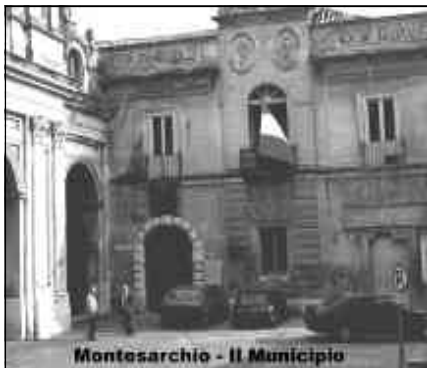
Montesarchio - Il Municipio