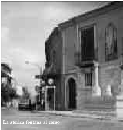
La storica fontana al corso

denigratori dell'attività della giunta e della maggioranza che amministrano il paese.