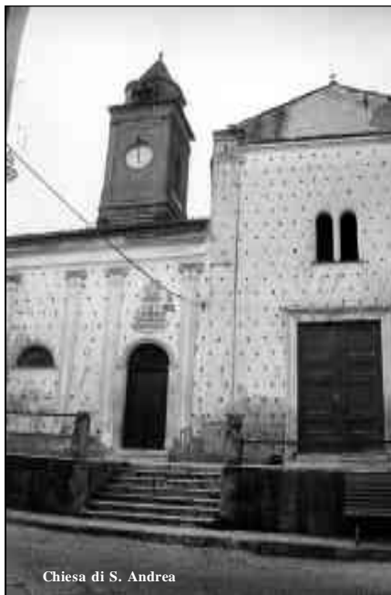
Chiesa di S. Andrea

tilene si era resa necessaria a causa di avarie nei vecchi condotti, ormai lì da più di quarant'anni. È, difatti, in corso la posa in opera del basolamento che è preceduto dall'allestimento di un pianone in cemento che eviterà il ribassamento delle basole. A giorni partirà anche il secondo lotto, come il primo finanziato