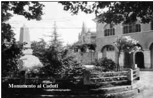
Monumento ai Caduti

In conclusione, uomini e donne alla pari dovranno collaborare ancor più in avvenire, per il bene del paese, che deve avanzare sulla strada del progresso civile, evitando così che possa scomparire e restare solo un ricordo storico-geografico.